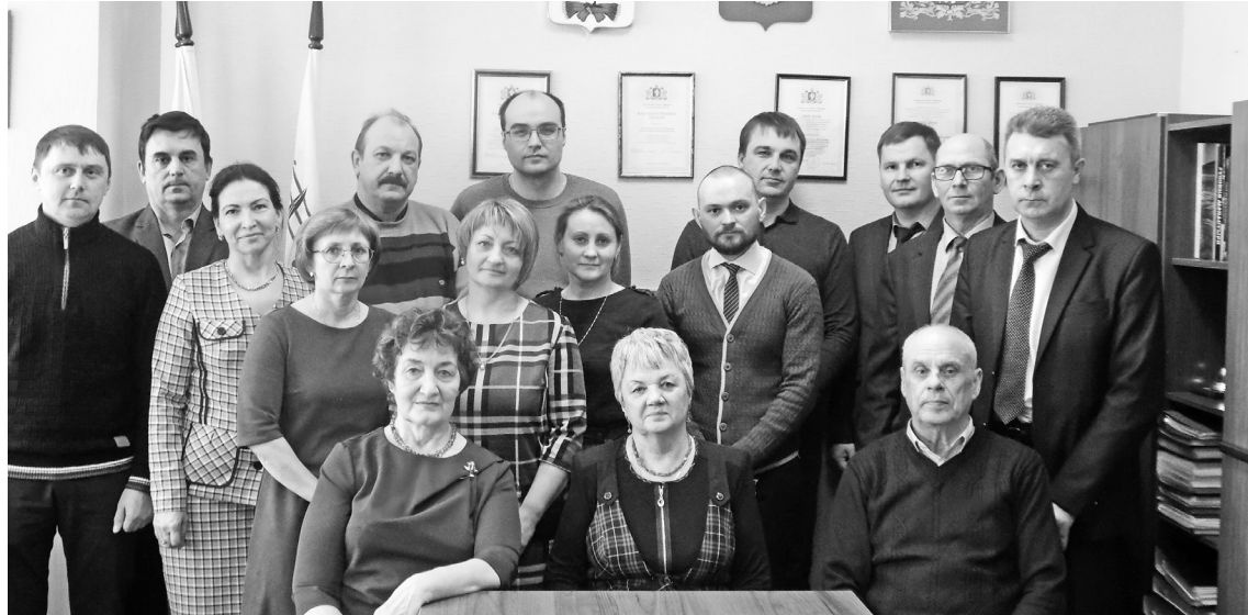
Депутаты с главами МО и представителем регионального оператора «Спецавтобаза».

ний на комплектование книжных фондов муниципальных библиотек, а также на организацию и проведение праздников, конкурсов и фестивалей для населения и другие.